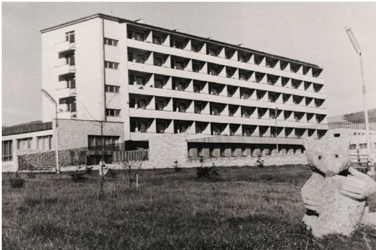
Sanatorium „Metalowiec” w Żłockiem

Muszyny i Żłockiego zostały uznane za lecznicze 7 .