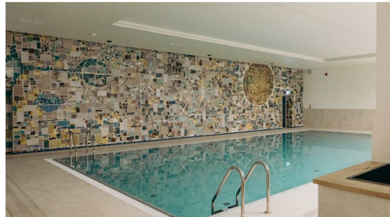
Arche Metalowiec Muszyna