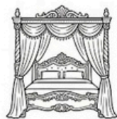
Pokój DELUX dla Nowożeńców.