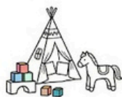
Kreatywny kącik dla dzieci.