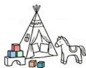
Kreatywny kącik dla dzieci.