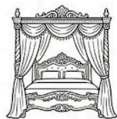
Pokój DELUX dla Nowożeńców.